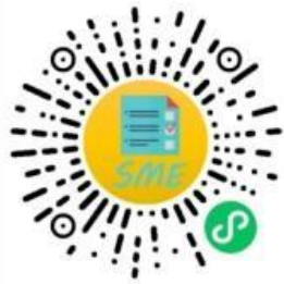
中小企业规模类型自测小程序

申明：测试结果是依据测试者提供的所属行业和有关指标数据生成，其信息真实性由测试者负责。