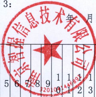
年月日常工作考勤表